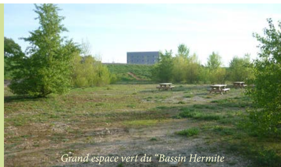
Grand espace vert du "Bassin Hermite"