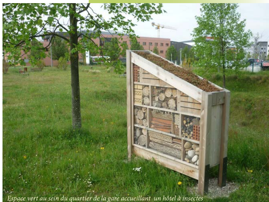
Espace vert au sein du quartier de la gare accueillant un hôtel à insectes