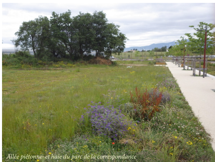
Allée piétonne et haie du parc de la correspondance