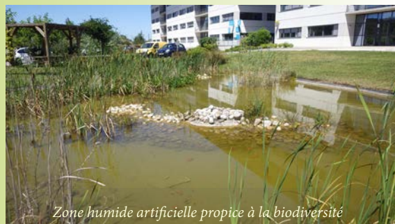
Zone humide artificielle propice à la biodiversité