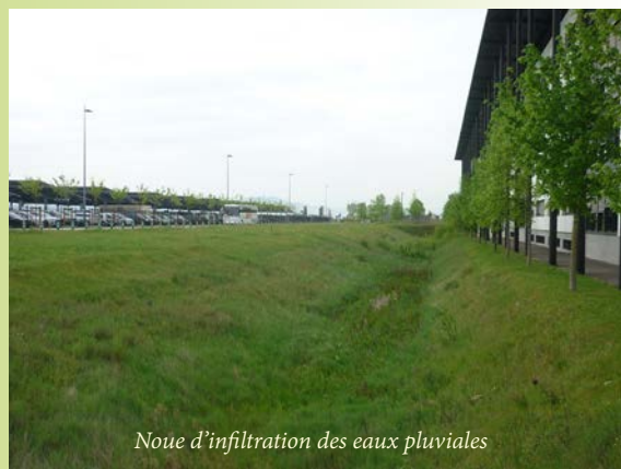
Noue d'infiltration des eaux pluviales