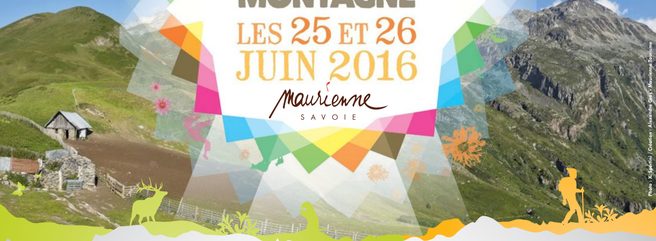
Création : Alexandre Gros - Maurienne Tourisme