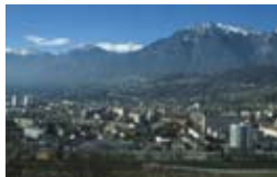
Contreforts des Bauges

Depuis son endiguement, la rivière Isère a un flux régulé qui a permis la colonisation de ses berges fertiles.