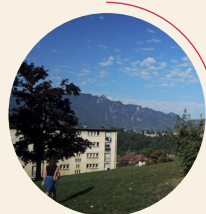
AIX LES BAINS