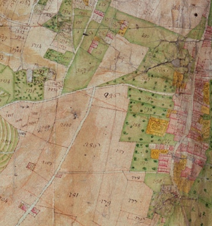
Mappe sarde - 1732 - Le Bourget-du-Lac