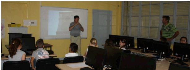
atelier 2 : Et si, avec des cubes ... on s'intéressait à l'espace avec un outil numérique