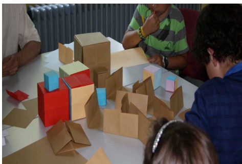
atelier 3 : Et si, avec des cubes ... on faisait une sculpture