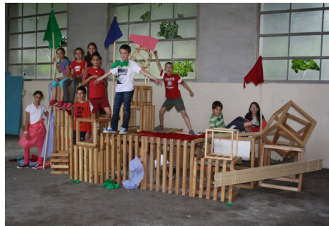
atelier 1 : Et si, avec des cubes ... on fabriquait une cabane