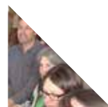
Un autre chemin - La résilience québécoise