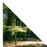
Le temps des forêts

Il est également co-auteur avec Téboho Edkins de Gangster Project (2011 - 55'), et Gangster Backstage (2013 - 38').