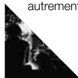
De cendres et de braises

Ses films, à la fois politiques et poétiques, explorent des territoires en marge, à la rencontre de ceux qui les habitent, cherchant dans le cinéma un moyen de faire résonner autrement leurs paroles.