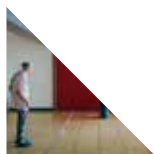
Bonne Maman et Le Corbusier

Aujourd'hui elle réalise des films pour des ONG, des musées et collabore à des documentaires pour la télévision. Après avoir suivi l'Atelier Documentaire de la Fémis en 2013, elle réalise son premier film documentaire sur La Cité Radieuse de Marseille : Bonne Maman et Le Corbusier .