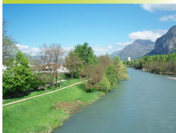
Une réflexion liant TVB et déplacements : le schéma piéton est déconnecté des voiries à grand trafic. Ici, un cheminement le long du Drac, très emprunté le week-end et pour les trajets domicile-travail.