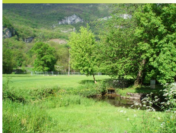
Parmi les actions renforçant la TVB de Fontaine : des mares accessibles à vocation pédagogique, des jardins collectifs et une prairie fleurie ont été créés. Ici, le parc de la Poya, qui renforce la connexion Vercors – Drac en « pas japonais ».