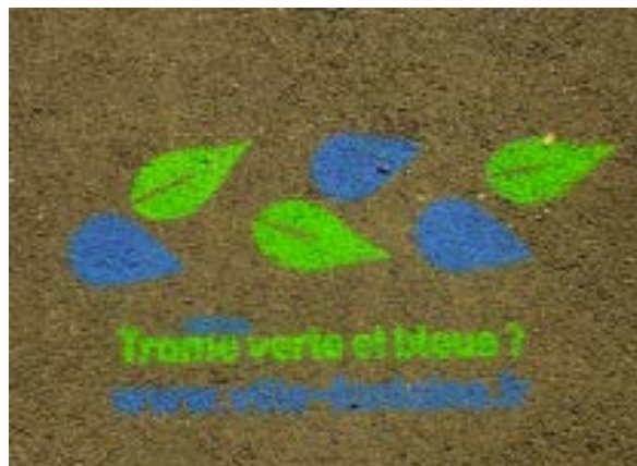
Pochoirs réalisés sur les trottoirs, lors de la quinzaine de la nature en ville.

La Ville prévoit la création de trame verte via l'aménagement d'espaces verts et, dès 2018, la prise en compte de la nature en ville via des diagnostics et inventaires écologiques. Enfin, des travaux de restauration de la trame bleue se matérialiseront par la création de bassins naturels ou la réouverture de ruisseaux.