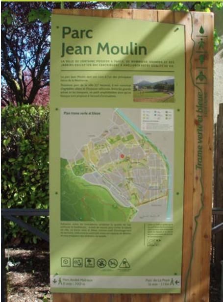
Action phare en matière de communication et de sensibilisation : la carte de la TVB, installée à l'entrée des parcs de la ville et participant à une TVB plus visible.

Adoptée par le Conseil Citoyen des Fontainois du 26 avril 2012, cette carte de la TVB de Fontaine a été co-construite lors de trois ateliers de concertation.