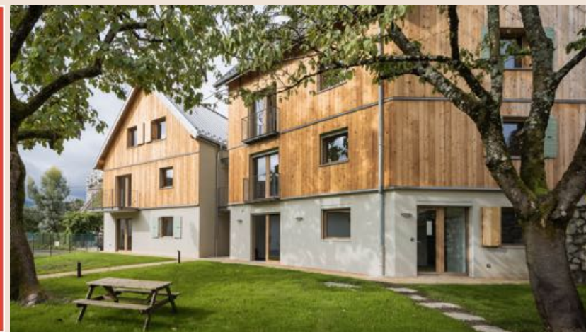
Opération Les petits paliers à Chambéry