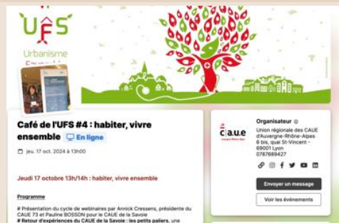
Les Cafés de l'UFS