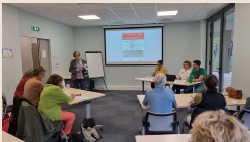
Table-ronde architectes conseils