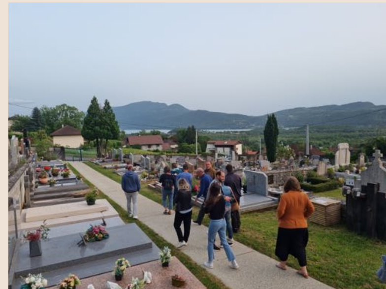
Visite du cimetière de Chindrieux