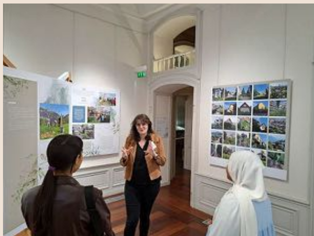
Exposition Le végétal en ville à Chambéry